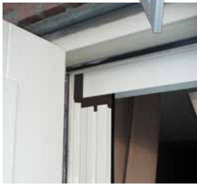
Bovenrail met treklijst (gesloten)

De hordeur en de geleiders zijn standaard uitgevoerd in hoogwaardig aluminium, gemoffeld in wit (RAL 9010) en crème (RAL 9001). Andere RAL-kleuren zijn op aanvraag leverbaar. Het gaas is zwart.