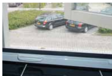
Onderlat met handgrepen