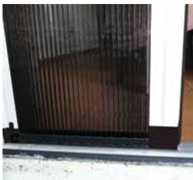
Onderrail met hordeur