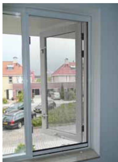
Gaspra raamrolhor (gesloten)

De raamrolhor is gemoffeld in wit (RAL 9010), crème (RAL 9001), antraciet (RAL 7016) en technisch zilver. Het gaas is grijs.